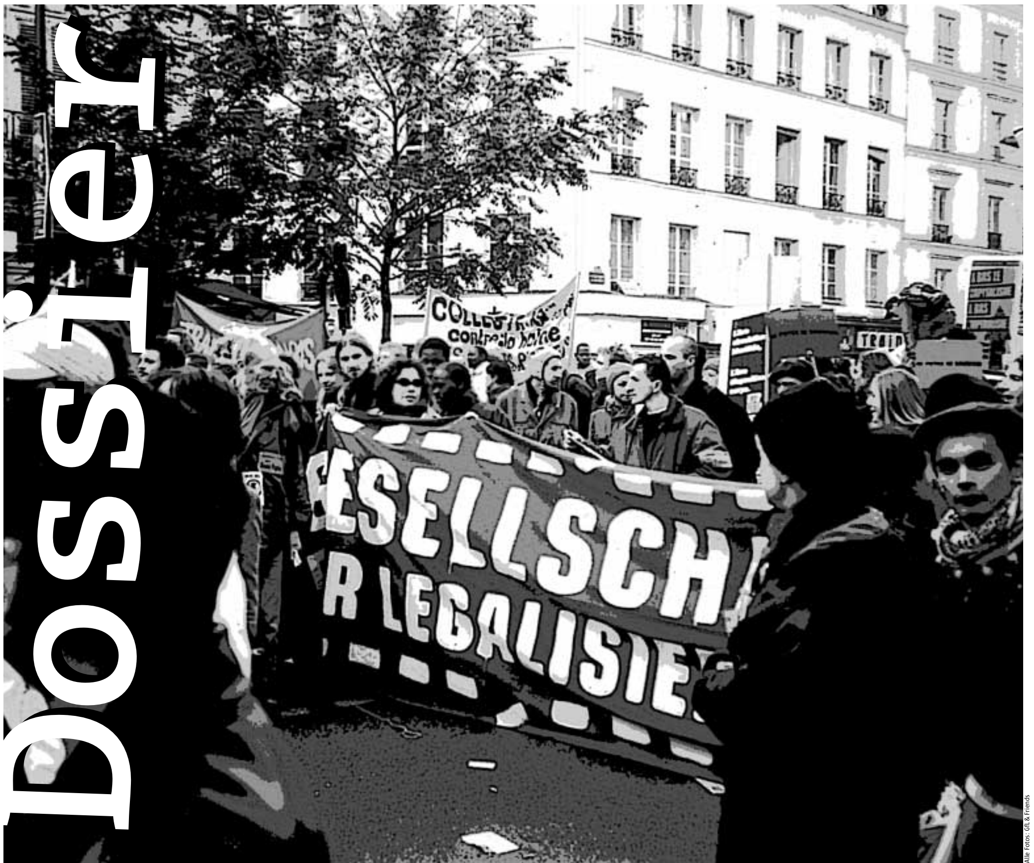
Letzte Woche: Die GfL Außenstelle Paris auf der Abschlussdemonstration des ESF