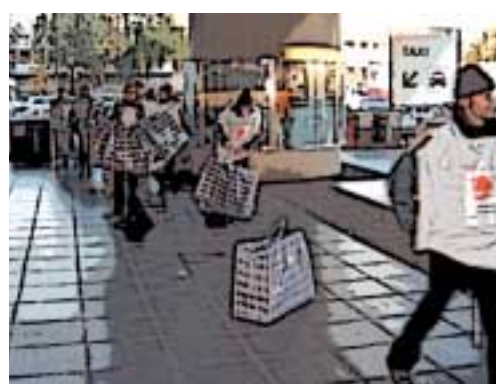
Die Gesellschaft für Legalisierung unterwegs in Berlin am 24. Oktober / und zwischen dem 13. und 16. Oktober in Paris (gegenüberliegende Seite)